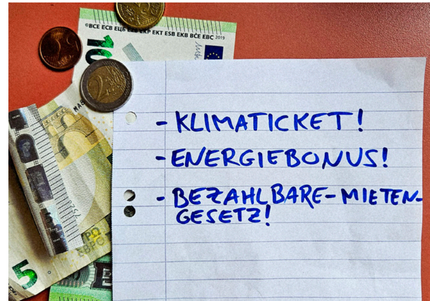
Klimaticket, Energiebonus und das Bezahlbare-Mieten-Gesetz: Unsere Vorschläge für ein bezahlbares und klimafreundliches Berlin.

Wohnen ist ein Menschenrecht. Doch immer mehr Berliner*innen können ihre Miete nicht mehr bezahlen oder finden keine neue Wohnung. Deshalb kämpfen wir im Bezirk gegen Zweckentfremdung,