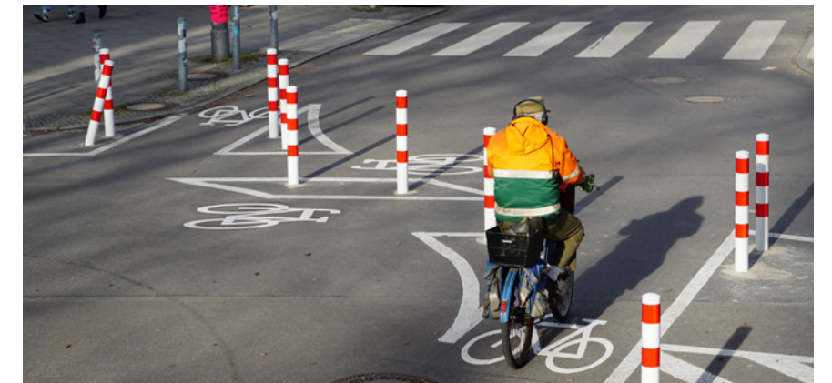
60% weniger Unfälle mit Verletzten als im Vorjahr: Nach Umsetzung des Kiezblocks sanken die Unfallzahlen im Reuterkiez erheblich.

Sichere Wege bedeuten für uns: die Freiheit, sich ohne Sorgen für