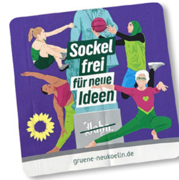
„Sockel frei für neue Ideen“ – Ein Sticker der AG Feminismus zur Debatte um das Jahn-Denkmal.

Ein Beispiel für die Auseinandersetzung mit solchen Weltbildern ist das Jahn-Denkmal in der Hasenheide. Friedrich Ludwig Jahn gilt als Begründer der deutschen Turnbewegung. Gleichzeitig schloss er Frauen und jüdische Menschen bewusst aus. Trotzdem wird er bis heute mit einem Denkmal geehrt.